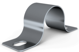
AP klammer 40 mm