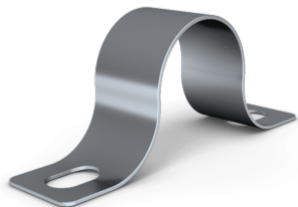
Klammer JR 150